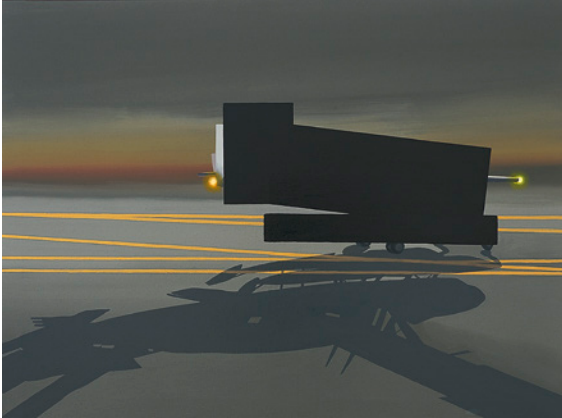
De Sondika a La Paloma , 2007.

Temple vinílico sobre loneta, 97 x 130 cm