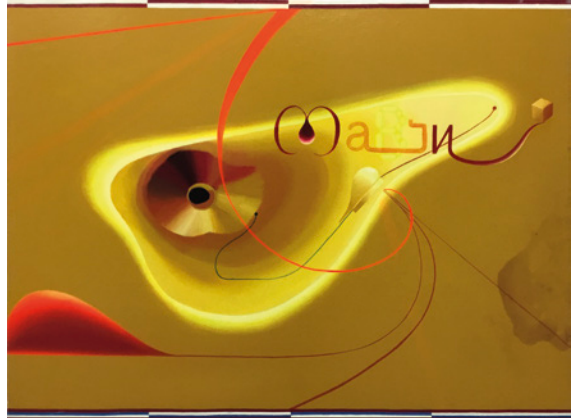
L'isola qui nous attend , 1998.

Temple vinílico sobre loneta, 97 x 130 cm