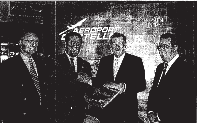
► El aeropuerto de Castellón continúa exportando su imagen de la mano del Villarreal por toda Europa.