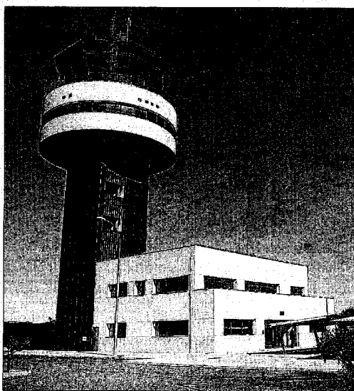
La torre de control está por equipar aún.

► A la izquierda, el director de Aerocas, junto a Camps, sentado en el puesto de navegación de la torre de control, cuyos equipos no se han instalado aún. Los técnicos de AENA tienen que supervisar su emplazamiento. En el centro, acceso por carretera al aeropuerto, que va con retraso, aunque la conselleria garantiza que estará ejecutado a mitad de año. A la derecha, imagen del interior de la terminal de pasajeros.