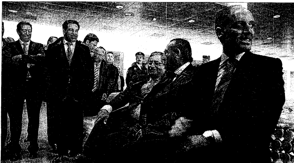
Camps, Fabra y el director de Aerocas, sentados en un banco de la terminal, en su visita de ayer.

La cautela con la que los gestores del aeropuerto hablaron de las previsiones de tráfico y los condicionantes que pusieron contrastan con el triunfalismo del presidente de la Generalitat, Francisco Camps, y de su homólogo en la diputación de Castelló, Carlos Fabra, quienes visitaron ayer las instalaciones. Cuando aún no se ha inaugurado el aeropuerto, Camps ya habló de ampliar la terminal para llegar a tres millones de viajeros. Fabra, por su parte, depositó «toda la esperanza» del turismo en el Costa Azahar.